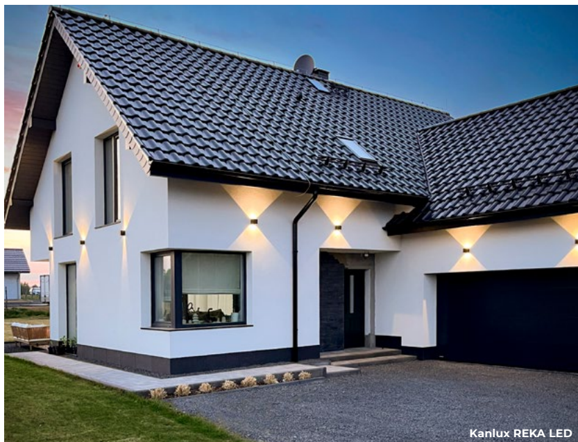
Kanlux REKA LED

nie główne, punktowe, dekoracyjne. Na tym etapie możemy już wstępnie myśleć o konkretnych oprawach, czy będą to okazały oprawy na długich zawieszakiach, a może nowoczesne spoty, które wymagają sufitów powieszanych. Możemy zdecydować się na spójne kolekcje do całych pomieszczeń – lampy wiszące, kinkiety, spoty tej samej serii, jak na przykład Kalux GALOBA.