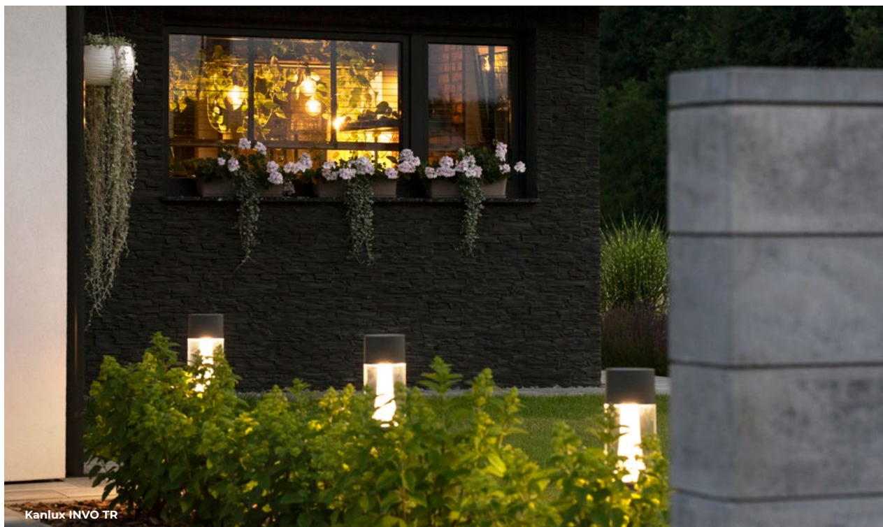
Kanlux INVO TR

Planowanie oświetlenia w domu jest kluczowym elementem projektu budowlanego, który powinien być przemyślany na wczesnym etapie budowy. Bardzo często zostawiamy ten aspekt na sam koniec, a to wielki błąd. Oświetlenie jest dla nas tym ostatnim elementem, na którym może da się zaoszczędzić, bo chcemy już zamieszkać, już mieć wszystko gotowe, a za rok, może dwa wymienimy lampę na tę inną, wymarzoną. Niestety, ale tak nigdy się nie stanie, zawsze będzie coś ważniejszego do zrobienia, kupienia, do zmiany, a to znacząco będzie wpływać na komfort naszego codziennego życia. Przypomnijcie sobie remonty mieszkania czy domu, najczęściej zmiany kolor ścian, na drugim miejscu są meble, zaraz za nimi podłogi, a oświetlenie najczęściej zostaje z nami przez kolejne lata. Oświetlenie domu to nie tylko lampy, pamiętajmy, że to także światło słoneczne, rozmieszczenie okien, drzwi, świetlików... Powinniśmy zatem pomyśleć o całościowym oświetleniu na kilku etapach budowy.